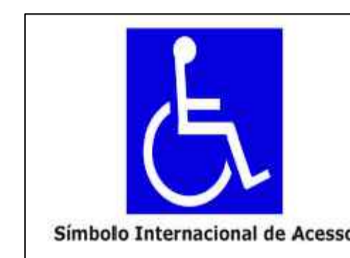
PLACA PL03 Sem Escala

*Obs: Letras em alto relevo, com cor contrastante.