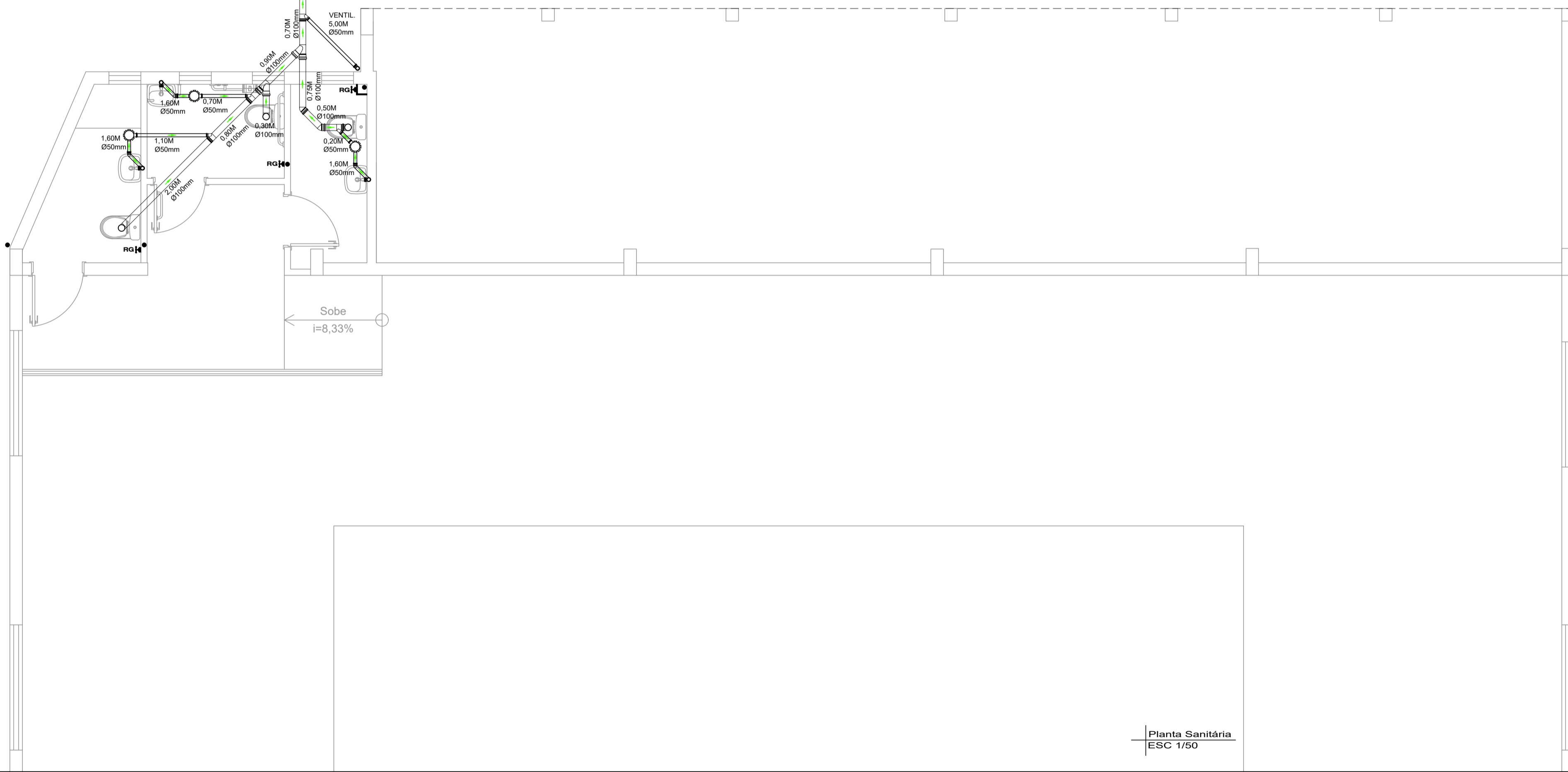
Planta Sanitária ESC 1/50