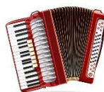
AC 110V KEY / SANFONA *Montar no chão