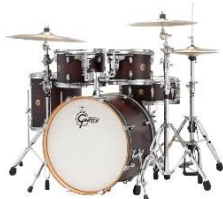
BATERIA *Montar 2 praticáveis