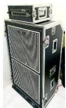
AC 110V BAIXO VS Mic SM 58 *Montar no chão