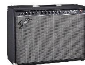
AC 110V GTR/ VIOLAO/ VIOLA *Montar 2 praticáveis